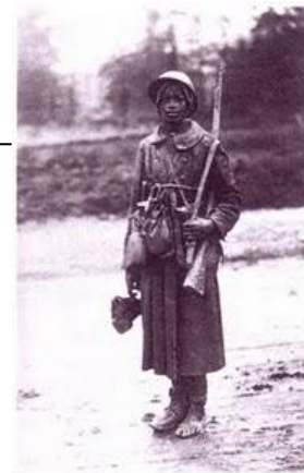
Guerre mondiale : un Sénégalais dans les lignes, à Verdun en 1915.