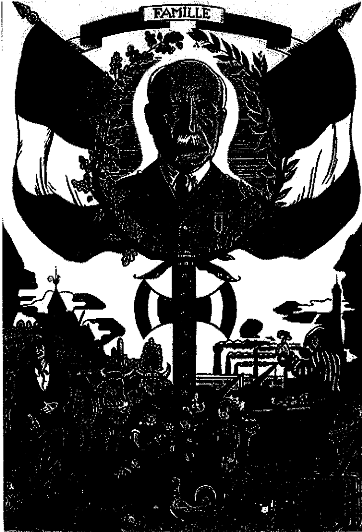
Image de propagande en faveur de la Révolution Nationale, 1941.

1. Sous quel régime politique a été réalisée cette image ? (1 point)